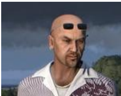
Obrázek 4 Informátor