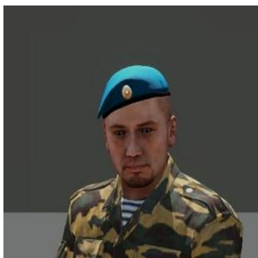
Obrázek 5 Důstojník, který má být zlikvidován