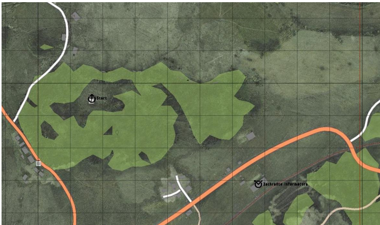
Obrázek 1 Oblast zájmu č. 1 nedaleko Černogorsku