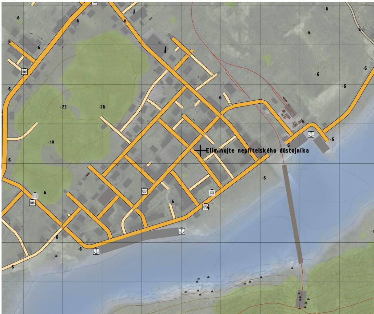
Obrázek 3 Oblast zájmu č. 2 Černogorsk